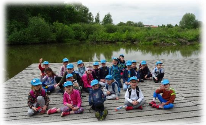
2. 6. 2023 Piknik na Poděbradech u příležitosti Dne dětí