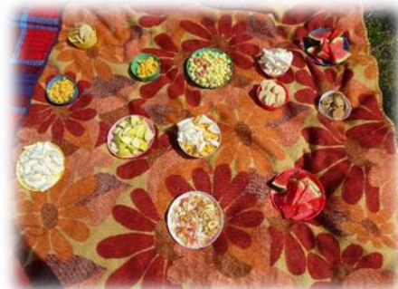
5. 6. – 9. 6. 2023 Léčebně rekreační pobyt - škola v přírodě Kunčice